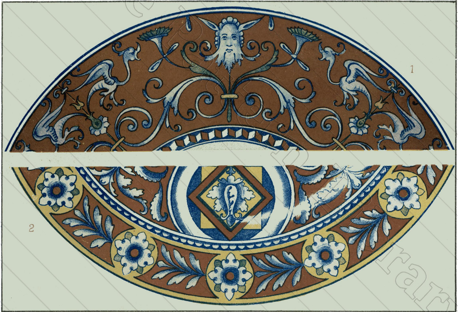
1. PLAT DE FAENZA _ 2. PLAT DE CHAFFAGIOLO