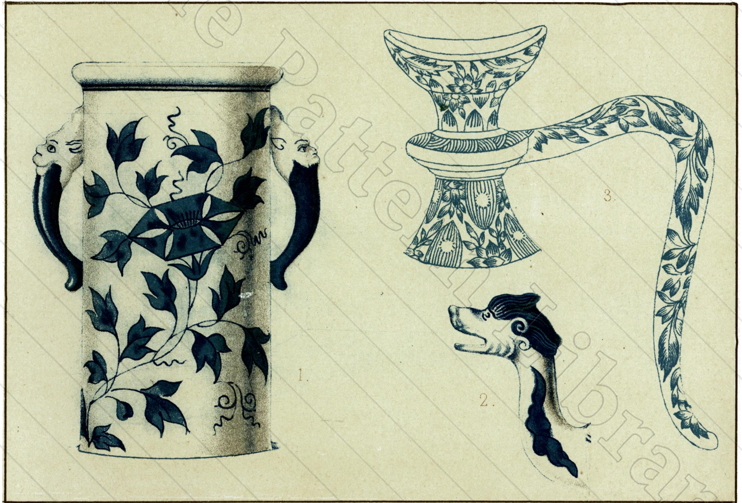
1. 2. VASES CHINE _ 3. AIGUIÈRE PERSANE.