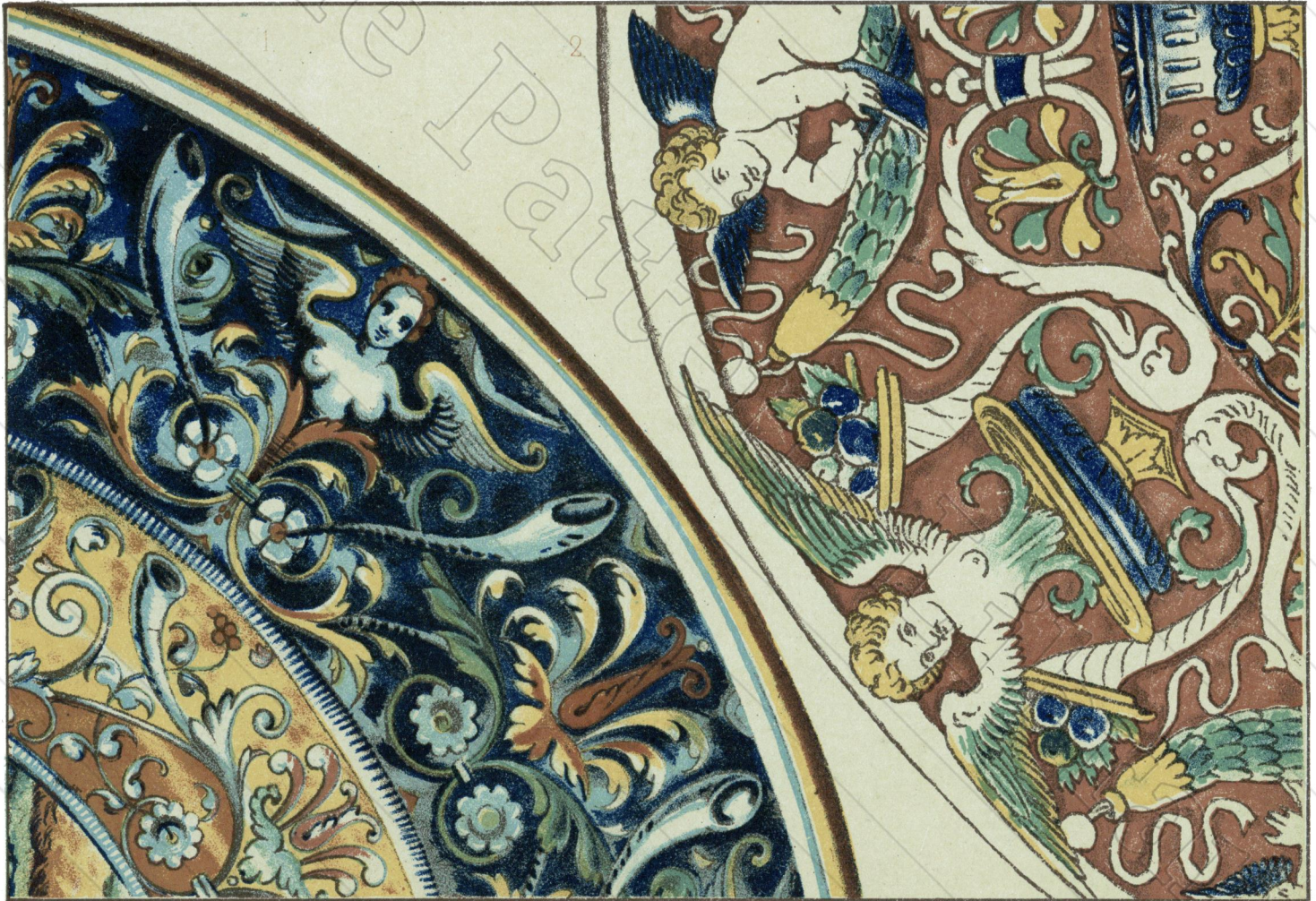
1. PLAT DE CHAFFAGIOLO _ 2. PLAT DE CASTELLO.